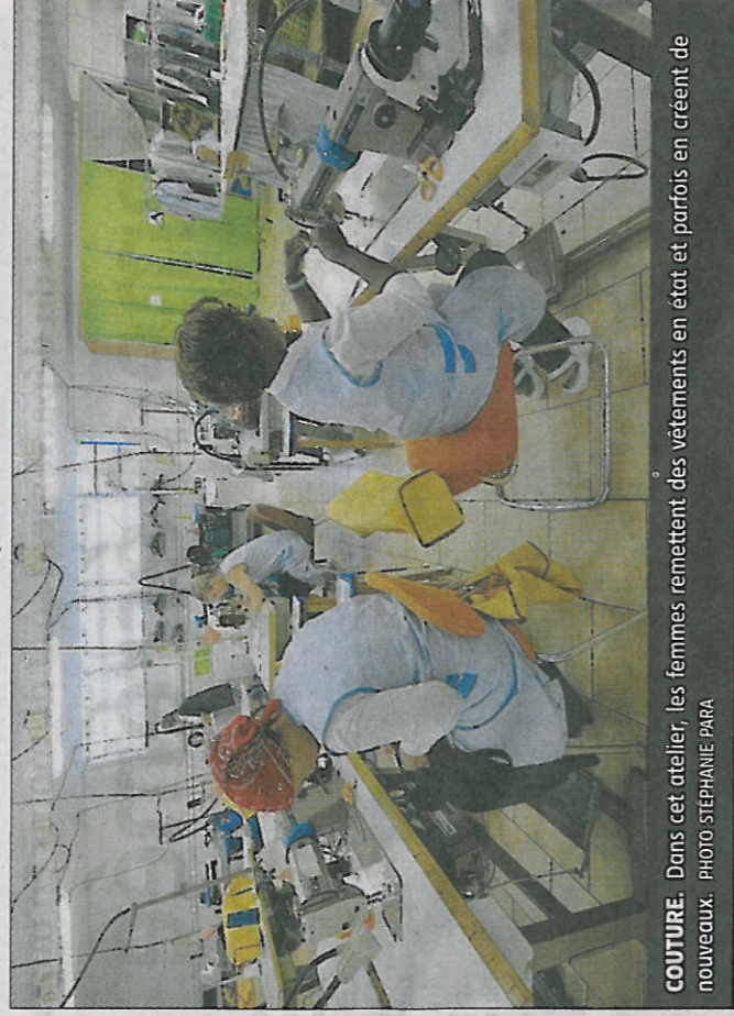
COUTURE. Dans cet atelier, les femmes remettent des vêtements en état et parfois en créent de nouveaux.

« L'ensemble étant vécu, insiste François Deschamps, en terme d'entraide, de soutien, d'insertion. Et en ne perdant jamais de vue que chaque individu est différent. »