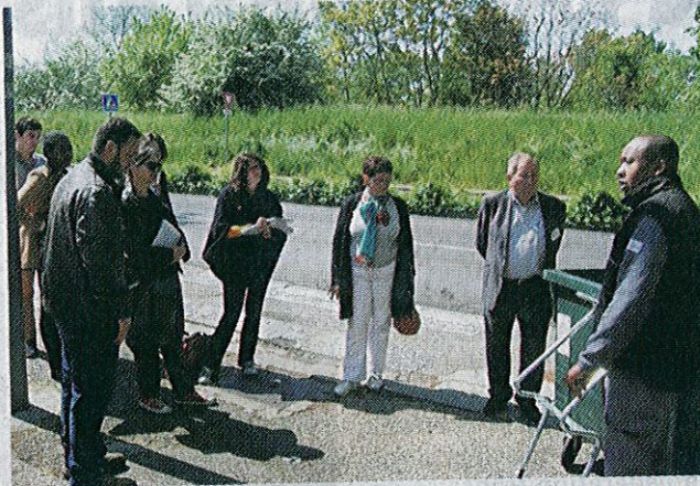
■ Unis vers l'emploi propose un parcours permettant à des personnes éloignées du travail de retrouver un travail pérenne.

« Nous avons travaillé avec les bailleurs sociaux afin de déterminer leurs besoins en recrutement. Il s'avère que le métier de gardien d'immeuble est souvent méconnu et le recrutement complexe, car des compétences techniques et relationnelles sont